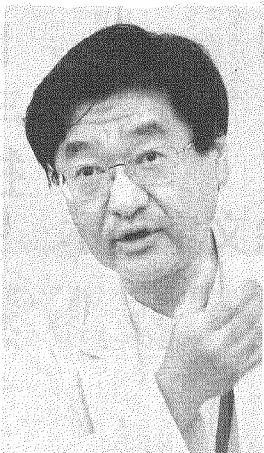
「混合診療は家計もため、患者の負担軽減につながる。がん治療薬の価格抑制策は、がん治療の普及に不可欠である。」

がん治療薬の価格抑制策は、がん治療の普及に不可欠である。がん治療薬の価格抑制策は、がん治療の普及に不可欠である。がん治療薬の価格抑制策は、がん治療の普及に不可欠である。」 「がん治療薬の価格抑制策は、がん治療の普及に不可欠である。がん治療薬の価格抑制策は、がん治療の普及に不可欠である。がん治療薬の価格抑制策は、がん治療の普及に不可欠である。」